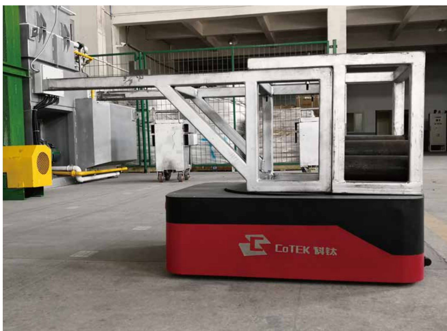
自動搬送台車取り付け事例